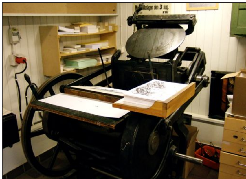
Chandler & Price från ca 1880 "Amerikanarn"

för att trygga museets framtid. Man var också överens om att någon entréavgift inte skulle komma ifråga.