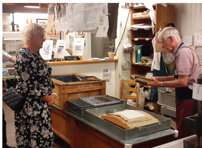
Handgjort papper tillverkades av Steen.